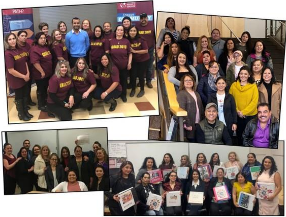
Sawiru waxa weeye ardayda Yakima Valley College, xarunta Yakima iyo sidoo kale xarunta Grandview.